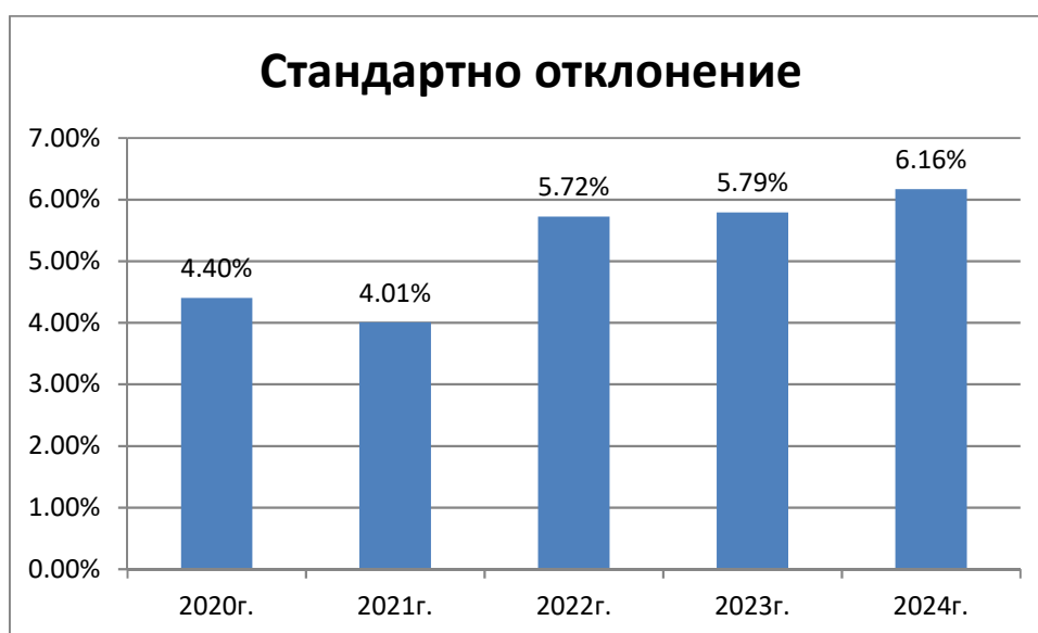
Стандартно отклонение на доходността за последните 5 години

Посочените резултати се отнасят за минал период и не следва да се считат като обещание за бъдещи резултати.