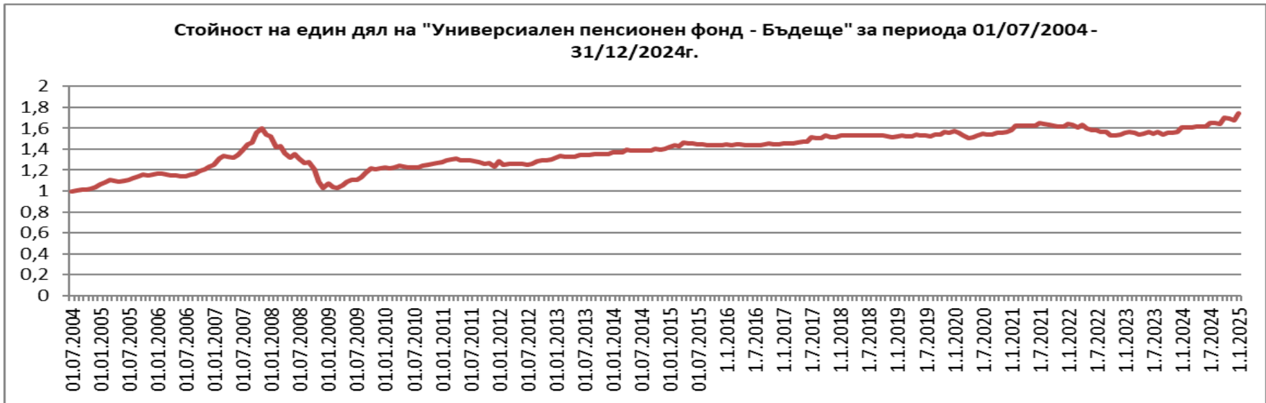
Стойност на един дял на ФДЗПО управлявани от „Пенсионно осигурително дружество – Бъдеще“ АД за периода 01/07/2004г. – 31/12/2024г.