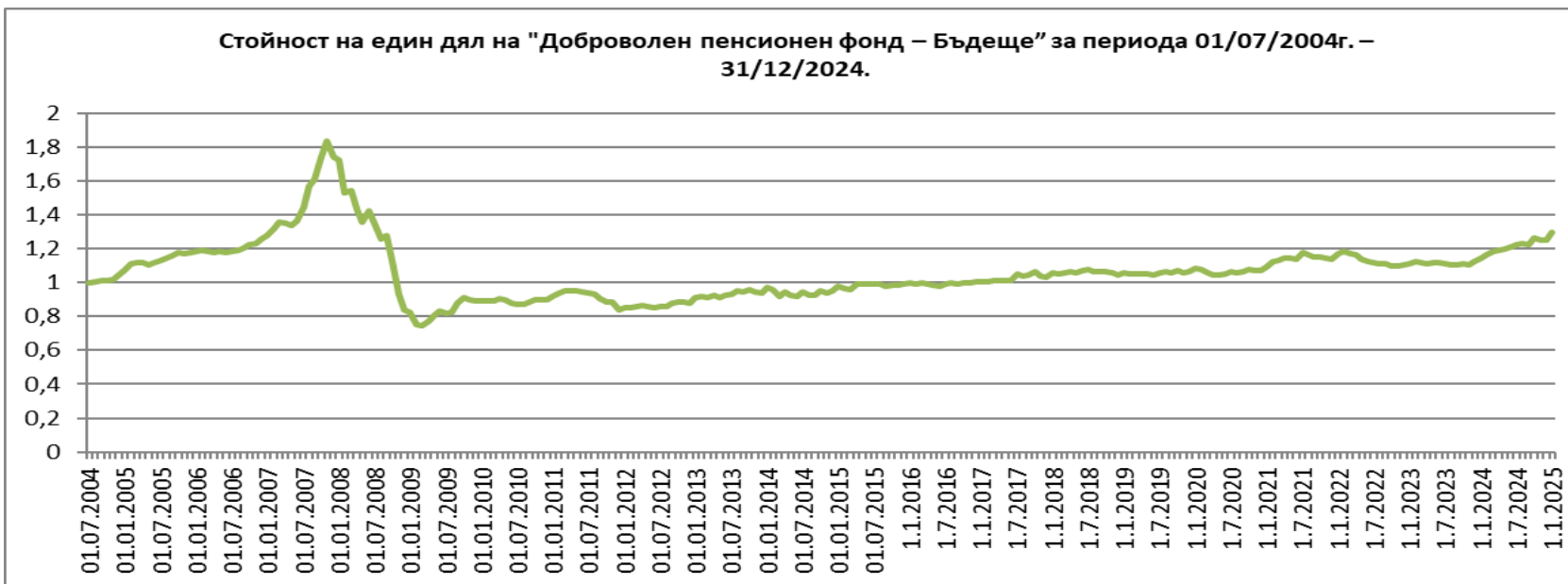
Стойност на един дял на ФДЗПО управлявани от „Пенсионно осигурително дружество – Бъдеще“ АД за периода 01/07/2004г. – 31/12/2024г.